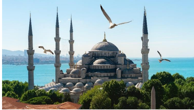
Hình 2. Thánh đường (Masjid) nơi thờ phượng thượng đế Allah của tín đồ Islam.

c). Tôn giáo Awal/Ahier (tiếng Ả Rập), cả hai dòng đều thờ duy nhất Thượng đế Allah.