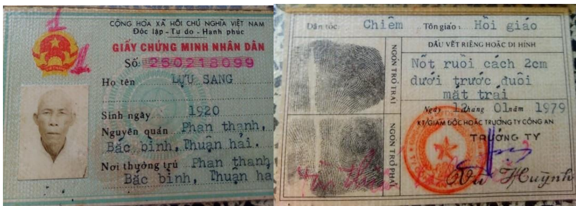
Hình 5. Giấy CMND, dân tộc Chiêm, Tôn giáo Hồi giáo, do công an Thuận Hải cấp năm 1979.

Sau 1975, thời Việt Nam Xã Hội Chủ Nghĩa (XHCN), trong Danh mục tôn giáo của Ban Tôn giáo Chính phủ chỉ duy nhất ghi: Hồi giáo (không ghi Bani).