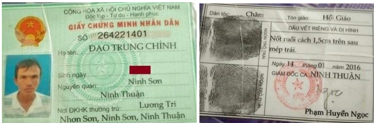
Hình 5. Giấy CMND, dân tộc Chăm, Tôn giáo Hồi giáo, do công an Ninh Thuận cấp năm 2016.

Thư hỏi Inrasara, CCCD sẽ được dùng cho cả 54 dân tộc Việt Nam, nhưng 53 dân tộc khác hoàn toàn đồng ý, nhưng chỉ có ông Inrasara và ông Thành Phần người Chăm phản đối Chính phủ Việt Nam, vậy 53 dân tộc kia không biết gì khi Chính phủ Việt Nam xóa tôn giáo và dân tộc của họ?