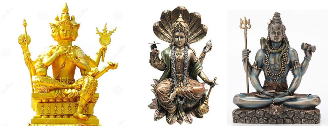
Hình 1. Tam vị thần Trimurti: Brahma (thần sáng tạo), Vishnu (thần bảo tồn), Shiva (thần hủy diệt).