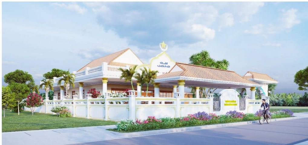
Hình 3. Thánh đường (Masjid/Magik) nơi thờ phượng thượng đế Allah của tín đồ Agama Awal. Thánh đường (Magik) thiết kế cho Bình Minh.

Khi thờ phượng Thượng đế Allah, thì Agama Ahier phải phụ thuộc hoàn toàn vào Agama Awal, vì dòng Ahier không có giới tăng lữ để phục vụ trực tiếp Allah, do đó phải mời giáo sĩ Acar từ phía Awal đến để phục vụ lễ tục.