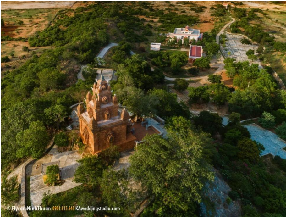
Hình 7. Tổng thể không gian, kiến trúc đền tháp Po Rome nhìn từ trên cao.