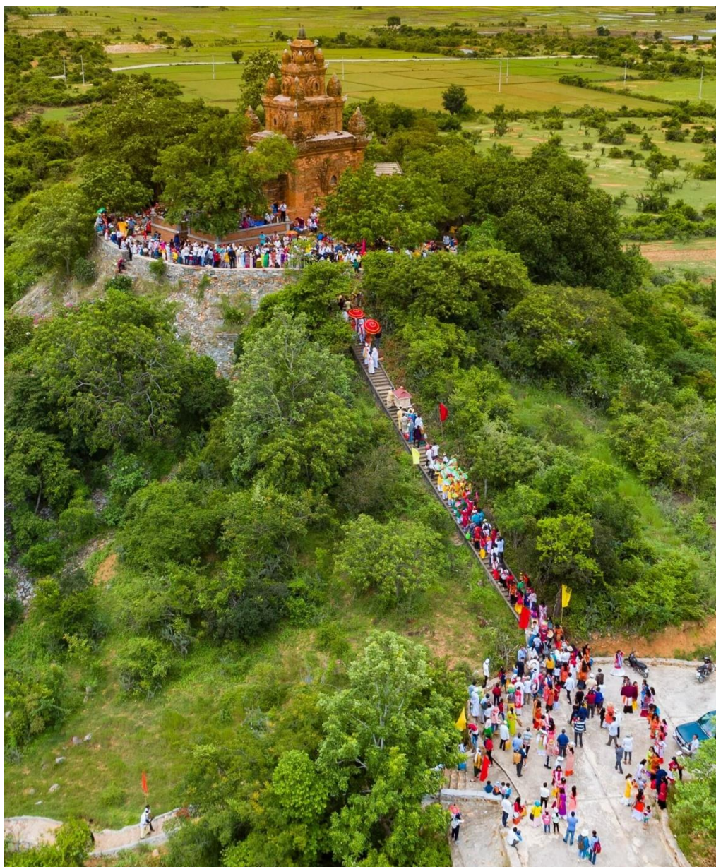
Hình 9. Quang cảnh tháp Po Rome trong ngày Kate tháng 7/2018 Chăm lịch. [Ảnh: Quảng Minh Kháng].