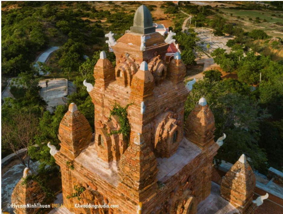
Hình 8. Kiến trúc chóp ngôi tháp chính.