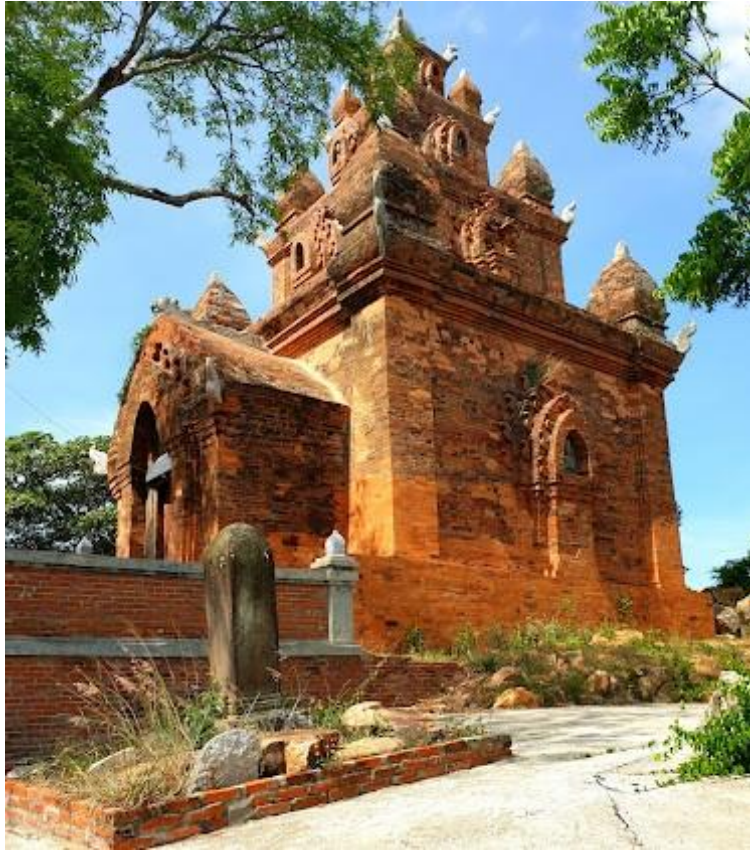
Hình 5. Tháp (bimong) vua Po Rome (Mustafa) tại Ninh Thuận.