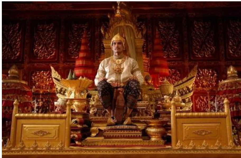
Hình 4. Vua Po Rome, niên hiệu: Nik Mustafa Bin Wan Abul Muzaffar Waliyullah. Dòng dõi vương triều theo Islam tại Serembi Makkah, thuộc tiểu vương quốc Kelantan-Malaysia.