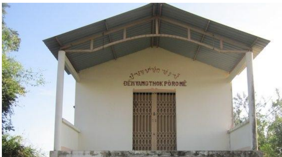
Hình 1. Đền Yang Thaok Po Rome, tại làng Pa-aok, Bình Thuận.

13. Cahya (ꠘꠞ ꠞꠞꠞꠞꠞ): Tên vị vua Po Rome nếu thờ theo Atuw [ꠞꠞꠞꠞꠞ] (Hồi Giáo) thì Ngài có tên là Cahya.