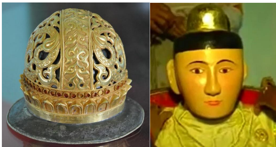
Hình 8. Po Bia Som (hoàng hậu Champa), vị hoàng hậu tôn sùng Islam là con gái vua Po Klaong Mah Nai (Po Mah Taha) và Bộ chụp tóc của hoàng hậu Bia Som.