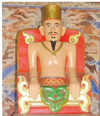
Hình 2. Vua Po Klaong Mah Nai (Po Mah Taha), 1622-1627, vị vua sùng bái Islam (Hồi giáo).

Vị vua cuối cùng của vương quốc Champa là Po PhaokThe (1828-1832), chứ không phải Po Klaong Mah Nai (1622-1627) như Sở Văn hóa, Thể thao và Du lịch tỉnh Bình Thuận đã nêu.