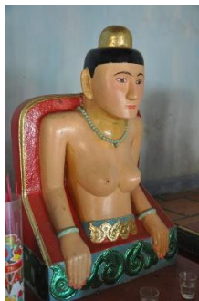
Hình 6. Po Bia Som (hoàng hậu Champa), vị hoàng hậu tôn sùng Islam là con gái vua Po Klaong Mah Nai (Po Mah Taha).