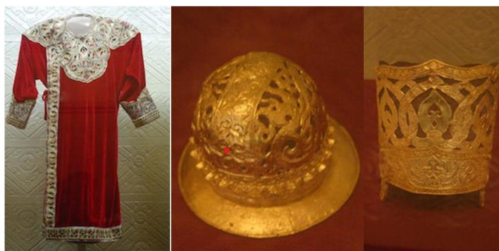
Hình 7. Một số bảo vật trong đền Po Klaong Mah Nai (Po Mah Taha).

Tất cả các pho tượng ở đền Po Klaong Mah Nai được coi là những tác phẩm điêu khắc nghệ thuật quý giá của nền điêu khắc cổ Champa. Tượng vua Po Klaong Mah Nai được tạc bằng một khối đá xanh với nghệ thuật điêu khắc tinh tế và độc đáo, pho tượng tả cảnh nhà vua đang ngự triều, đầu đội Vương miện oai nghiêm.