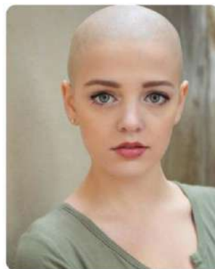
Hình 17. Nữ diễn viên tín đồ Công giáo cạo tóc, vì để tóc thấy vô số phiền não và thói hư, cạo tóc như bỏ đi những phiền não và ma tính của con người.