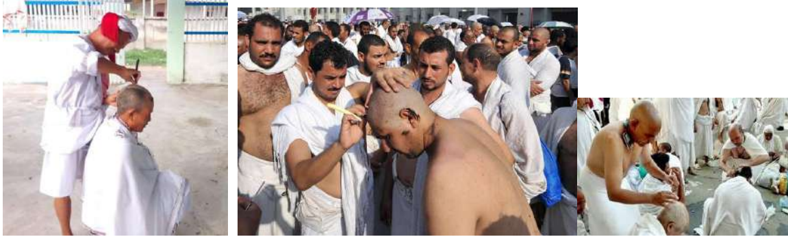
Hình 12. Giáo sĩ dòng Awal đang thực hiện cạo tóc (trái), Tín đồ Islam chính thống cạo tóc (phải).