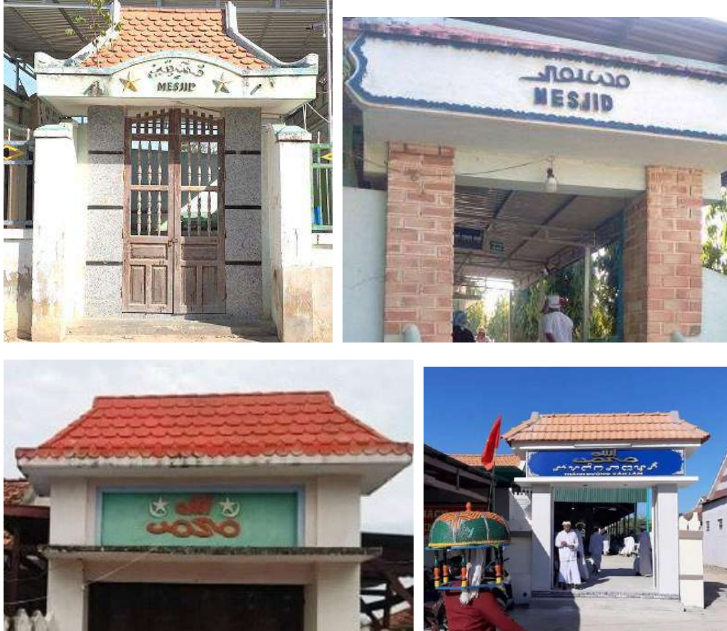
Hình 8. Một số cổng Thánh đường (Mesjid) tại Bình Thắng, Giang Mậu, Văn Lâm. Trên cổng ghi chữ Ả Rập Allah-Muhammad, biểu tượng ngôi sao, trăng liềm, chữ Thrah Chăm, ...