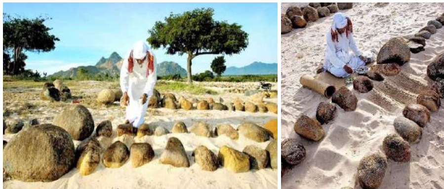
Hình 34. Giáo sĩ Hồi giáo (Awal) tảo mộ (kabur rak) thời Covid-19.