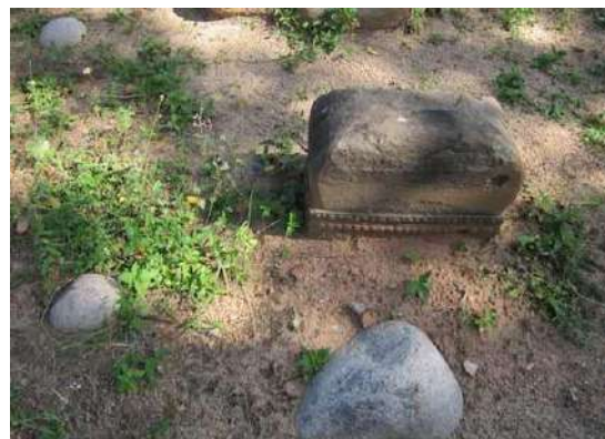
Hình 38. Bia đá (bataunisan) của phần mộ trên Tháp Po Rome.

Phần mộ Hồi giáo trên đền tháp có quan hệ như thế nào với vị vua Po Rome, cho đến nay vẫn là một câu hỏi chưa có lời kết luận cuối cùng. Có chăng đây là khu mộ của hoàng hậu Sumut có nguồn gốc Hồi giáo Malaysia?