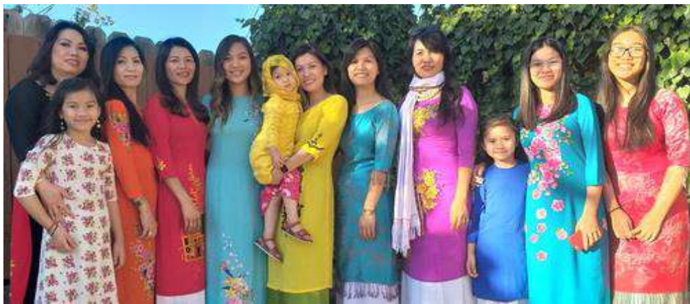
Hình 42. Tín đồ Chăm theo Hồi giáo (Bani Awal) tại Hoa Kỳ nhân dịp ngày lễ trọng đại Waha, con cháu về tụ họp, tề tựu với cha, mẹ, ông bà, gia đình và dòng họ để chúc phúc cho nhau và cầu mong Allah ban phước lành.