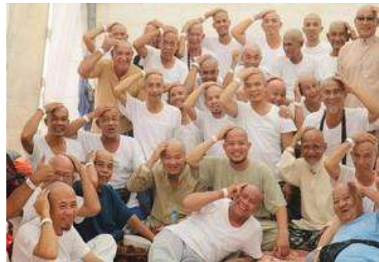
Hình 16. Tín đồ Bani Islam (Muslim) phải cạo tóc, mặc trang phục Ihram khi đi Haji hoặc Umrah.