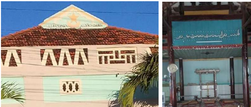
Hình 9. Biểu tượng ngôi sao, trăng liềm và dòng chữ Ả Rập trên đỉnh thánh đường (Mesjid) Thành Tín (trái) và dòng chữ Ả Rập “Bihmillahi rahmanir rahhim” trong thánh đường Phước Nhơn.