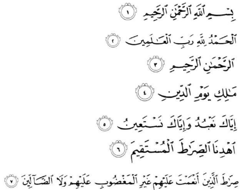
Hình 28. Surah Al-Fatihah chữ viết Ả Rập (Thiên kinh gốc).

Surah Al-Fatihah (Fathah) trong Thiên kinh Awal được Ts. Putra Podam phiên âm sang chữ Rumi Champa (tác giả: Putra Podam)