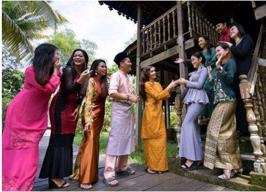
Hình 41. Tín đồ Bani Islam đến chúc nhau nhân đại lễ Waha tại Malay.