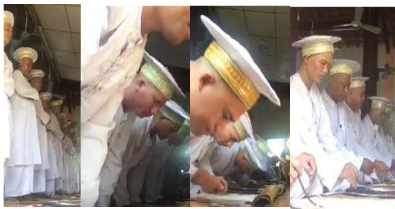
Hình 40. Một số Rukun Solat (động tác hành lễ) của Bani Islam và Bani Awal.