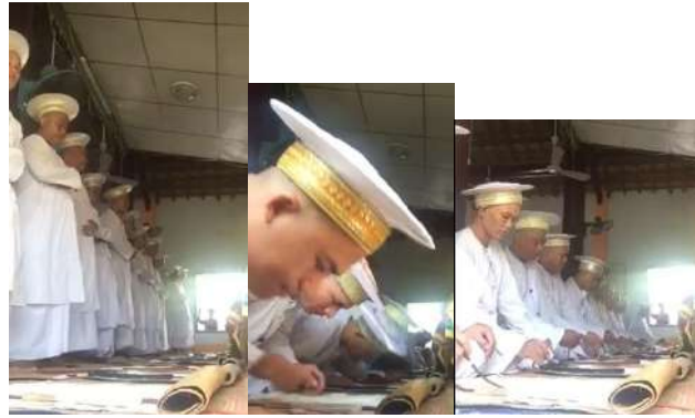
Hình 31. Giáo sĩ Hồi giáo (Awal) thực hiện các bước cầu nguyện.