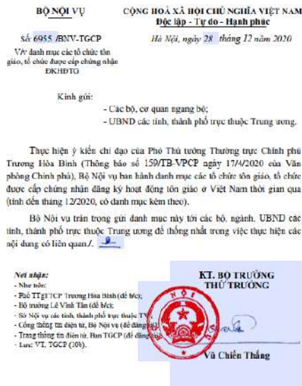
Hình 6. Danh mục các tổ chức tôn giáo được công nhận theo Quyết định Số: 6955/BNV-TGCP, ngày 28 tháng 12 năm 2020.