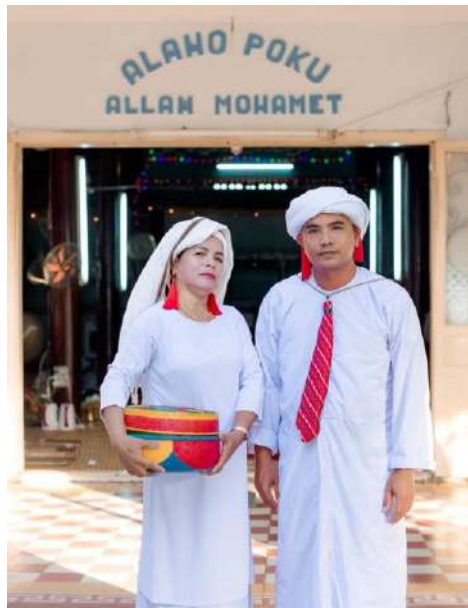
Hình 11. Câu trên: “Thượng đế của bề tôi”, câu dưới: Allah – Muhammad.

Lưu ý: Hai dòng trên, nhiều người suy diễn thành: Alahu Poku là bề trên của Allah và Muhammad.