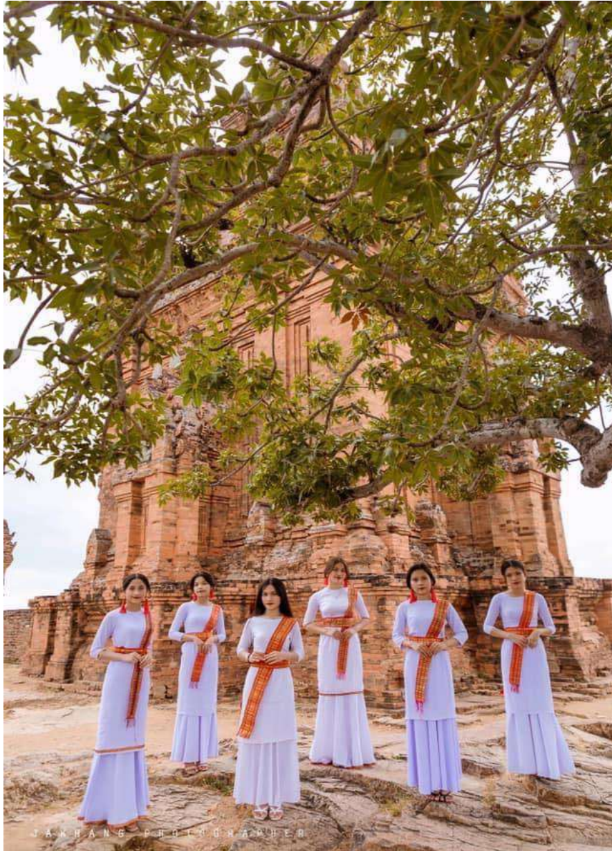
Thiếu nữ Champa trên tháp (Bimong).