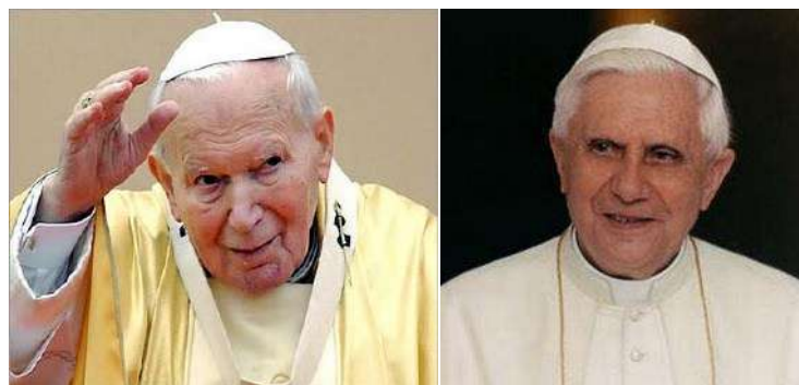
Hình 20. Kopiah Yahudi (kopiah do thái), Kopiah Kristian (kopiah của mục sư Tin lành hay Thiên chúa).