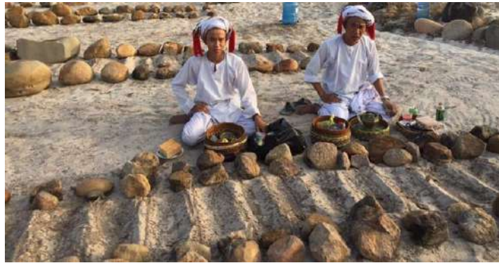
Hình 33. Giáo sĩ Hồi giáo (Awal) tảo mộ (kabur rak) thời Covid-19.