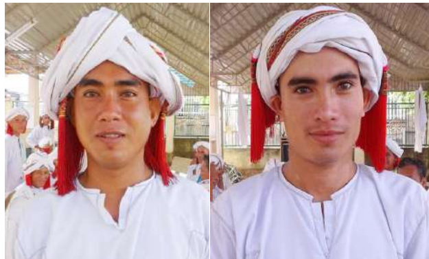
Hình 22. Khăn vấn hai lớp “khen jram” bên trong và “khen halang” bên ngoài (hình bên trái). Quần khăn một lớp “khen jram” (hình bên phải) của giáo sĩ hệ phái Awal ở Bình Thuận.