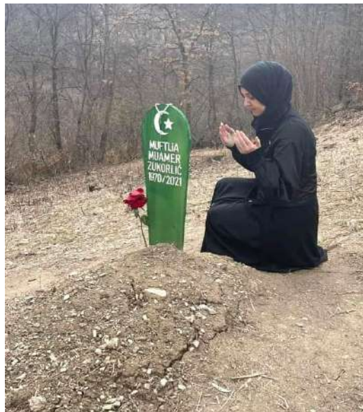
Hình 37. Phụ nữ Iran (Islam) tảo mộ, đọc Thiên kinh Koran.