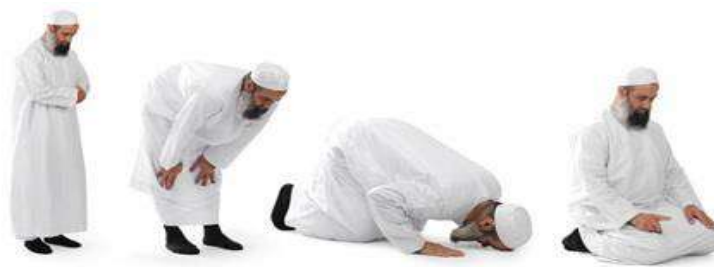
Hình 30. Tín đồ Hồi giáo (Islam) thực hiện các bước cầu nguyện.