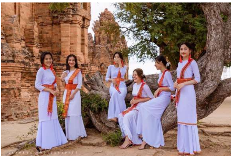
Thiếu nữ Champa trên Tháp (bimong).