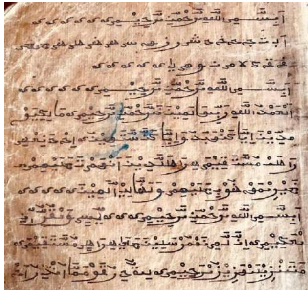
Hình 27. Surah Al-Fatihah của hệ phái Awal (Thiên kinh Koran).