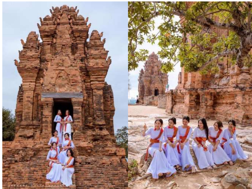
Thiếu nữ Champa trên Tháp (bimong).