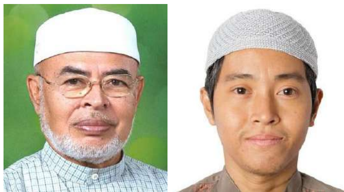
Hình 19. Tín đồ Bani Islam Malaysia đội chiếc mũ Kopiah (songkok).