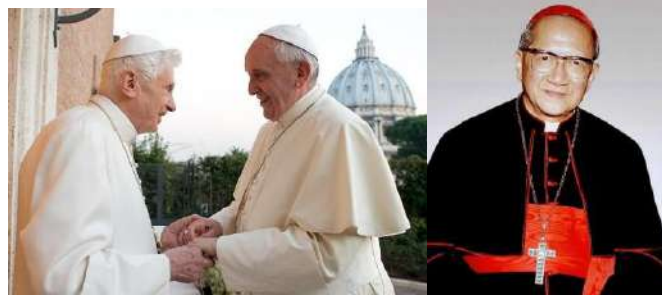
Hình 21. Đức Giáo hoàng (Hình trái) và Đức Hồng Y GIOVANNI BATTISTA RE: Đức Hồng Y Nguyễn Văn Thuận đội Kopiah (Kalah Aia).