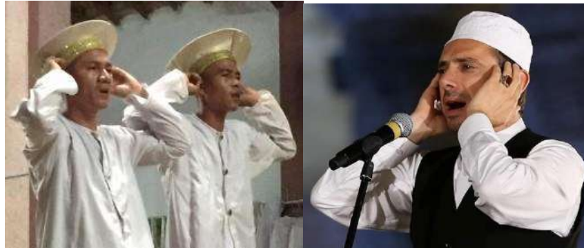
Hình 29. Giáo sĩ đang “bang” và “azan” thông báo giờ cầu nguyện giữa hệ phái Awal và Islam.

Theo luật định ta thấy những động tác rukun giữa Bani Awal và Bani Islam về thực hiện nghi thức Solat (Salah) thì hoàn toàn giống nhau.