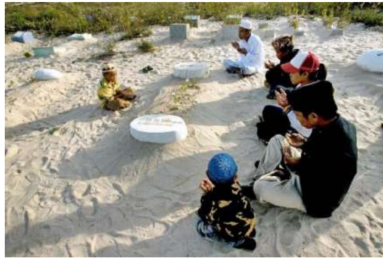
Hình 36. Chăm Hồi giáo (Islam) tảo mộ, đọc Thiên kinh Koran.