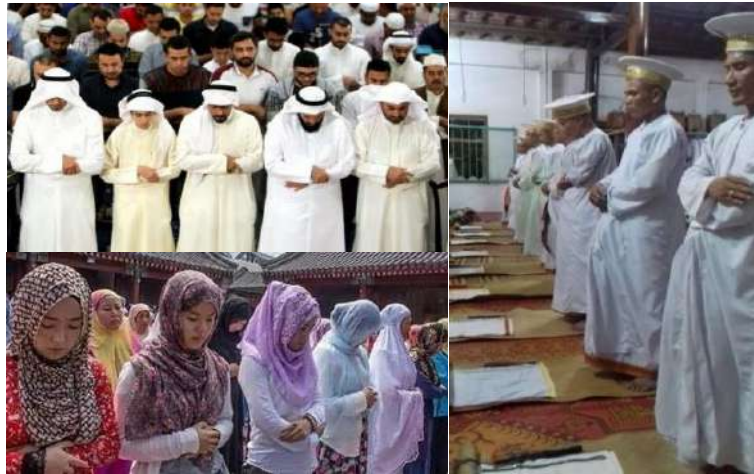
Hình 39. Solat (Salah) của Bani Islam và hệ phái Bani Awal.

Khi hành lễ Solat, họ thường đứng trên một tấm thảm (carpet), karma (tấm trải), chiếu (ciew), sajadah (sejadah), ciew bang, một loại chiếu cỏ hay chiếu lễ của người Chăm.