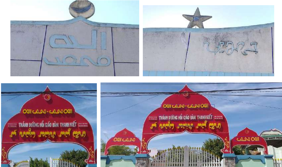
Hình 10. Biểu tượng ngôi sao, trăng liềm và dòng chữ Ả Rập Allah- Muhammad, chữ Thrah Chăm, chữ Việt trên đỉnh thánh đường (Mesjid) và cổng thánh đường.