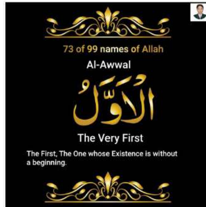
Hình 2a, 2b. Awal (Al-Awal), tên thứ 73 trong 99 tên của Thượng đế Allah.

Al-Awal (là một trong 99 Đại danh của Allah, Al-Awal là thứ tự 73 trong 99 tên của Allah. Nghĩa Đấng Đầu Tiên không có sự khởi đầu và tất cả vạn vật đều do Ngài duy nhất tạo hóa ra chúng.