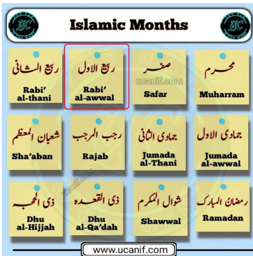
Hình 4. Tên tháng theo Hồi lịch Hijri (Islam).