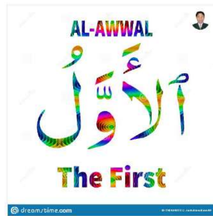
Hình 1a, 1b. Awal (nghĩa ban đầu, bắt đầu, đầu tiên, trước tiên, thời tiền Islam, ... tiếng Anh: The First, tiếng Chăm: 𑜉𑜂𑜫𑜄𑜫).

Awal : (أوال), nghĩa là: ban đầu, bắt đầu, đầu tiên, trước tiên, ...Awal là tên tháng đầu tiên trong Hồi lịch (Awal Muharam). Do đó, ngày đầu tiên của Muharam là ngày đầu năm mới của người Hồi giáo. Năm Hồi giáo còn gọi năm Hijra ( Hijri ), năm đầu tiên trong đó có Hijra (di cư của Thiên sứ Muhammad từ Mecca (Makkah) đến Medina (Madinah).