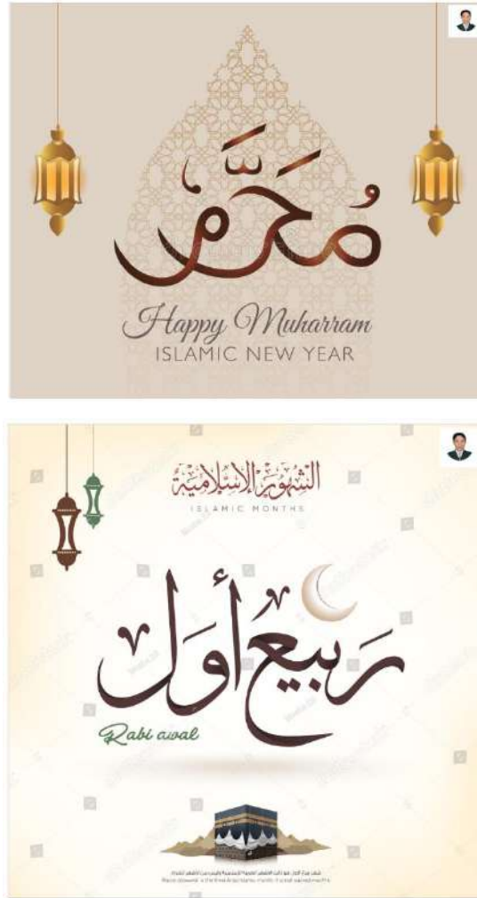
Hình 3a, 3b. Awal Muharam là tên tháng đầu tiên trong Hồi lịch, Rabi al-Awl tháng thứ ba trong Hồi lịch.

3. Awal : là tên tháng đầu tiên trong lịch Hồi giáo “Awal Muharam ” và trong tháng “ Rabi al-Awal ” thứ tư tháng thứ ba trong lịch Islam (Hồi giáo) nghĩa “Mùa xuân đầu tiên”.